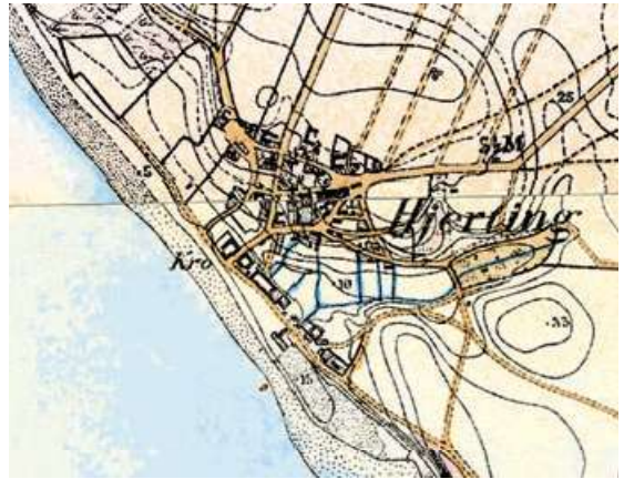
Gadernes forløb igennem den gamle del af byen svarer i dag nogenlunde til forløbet i ca. 1870.

Hjertings struktur med veje og gader er rimeligt velbevaret. Ligeledes er der stadig mange af de æl-